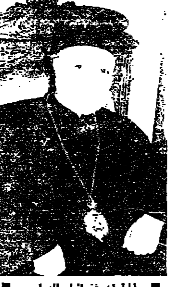
المران غفرانيل الصليبي

وزعماء شتى، وهم بل يبعد المواطن ومشاركهم جميعا. اجل، نريد عبورا لكل مواطن على السواء، يجب ان لا يتفك احد عن موكب النصر الى لبنان الواحد. ان نجد الاوطان متوقفة على نجد الانسان وهذا نحن جدير مشكلة لبنان. لا صيغة بدون محبة.